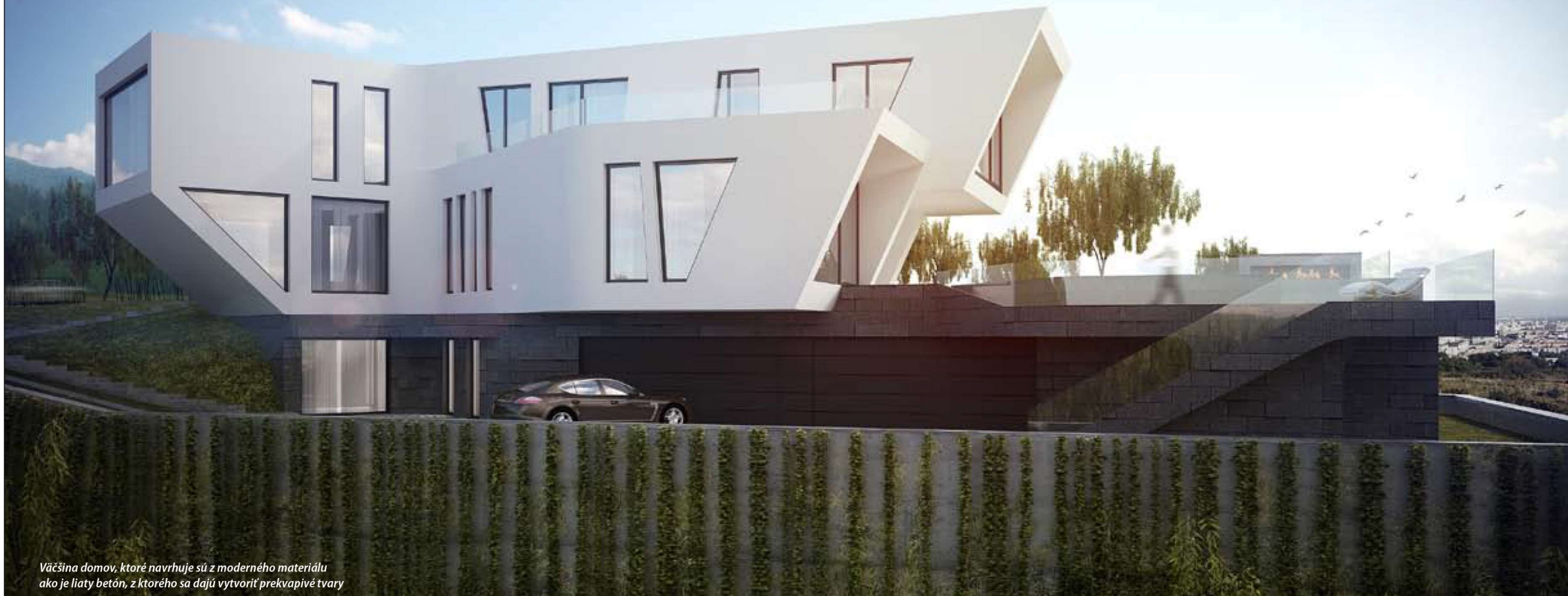
Väčšina domov, ktoré navrhuje sú z moderného materiálu ako je liaty betón, z ktorého sa dajú vytvoriť prekvapivé tvary

v architektúre nie sú. „Doba v ktorej žijeme je tak rýchla, že sa neudržia.. Trendy rýchlo vznikajú a zanikajú, sú prepojené s vývojom technológií a spoločnosti. No kvalita architektonického diela nie je na nich závislá,“ hovorí Revaj, ktorý vidí architektúru inak. „Každý pozemok, každý ten investor má niečo osobité a to by mal projekt reflektovať. Je to taký malý príbeh medzi pozemkom, architektom